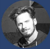
Stefan Thume Webdesign & Medien