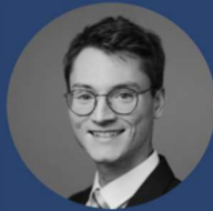
Richard Knirschig Quantitative Analyse & Charts