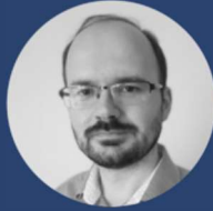
Peter Árendáš Autor